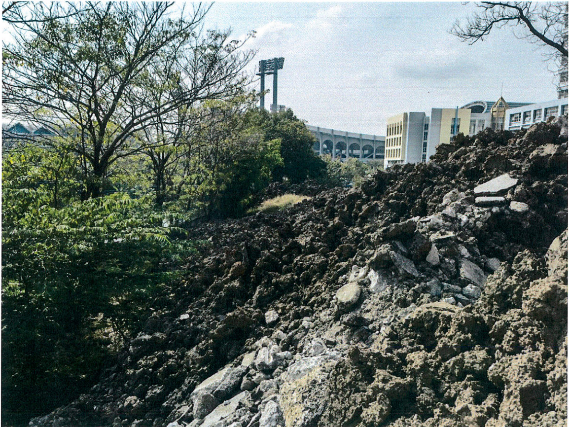
รูปภายใน-ด้านหลัง