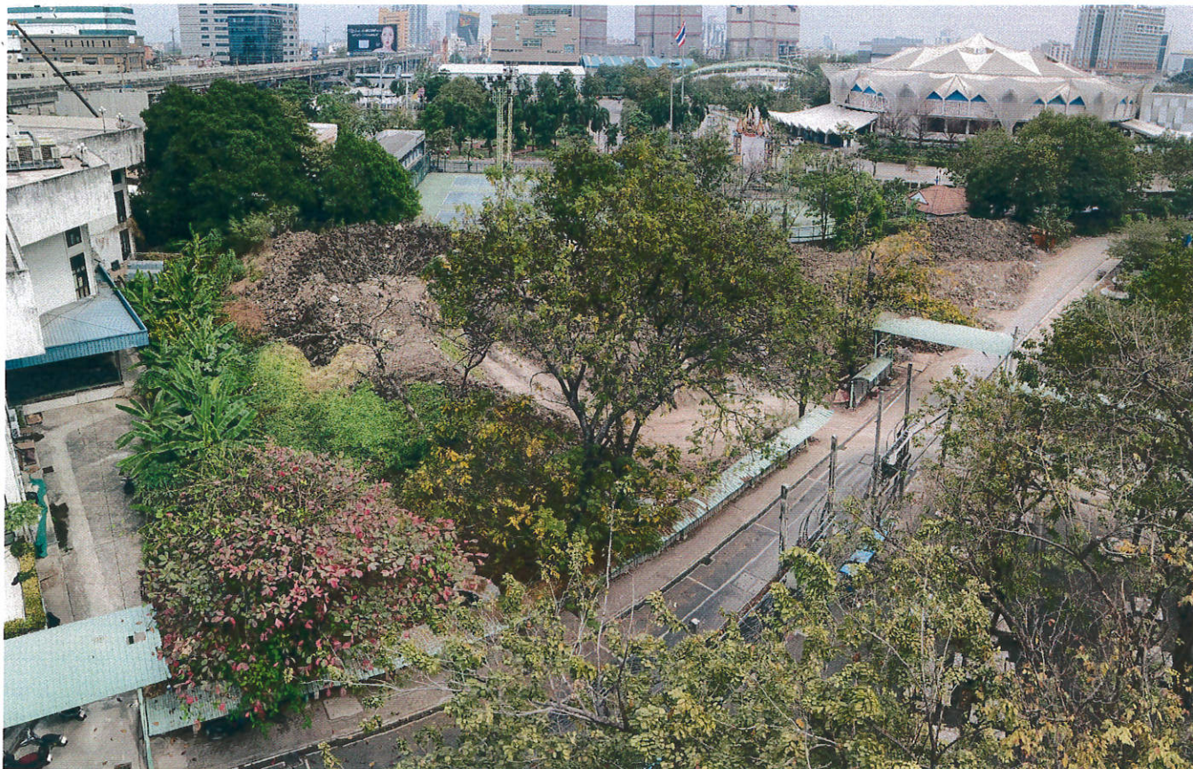
รูปมุมสูง