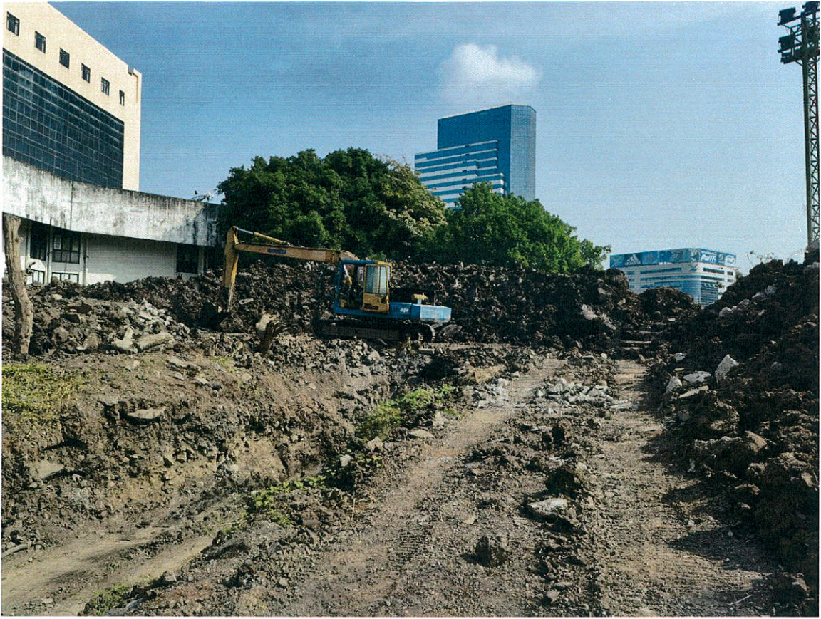
รูปภายใน