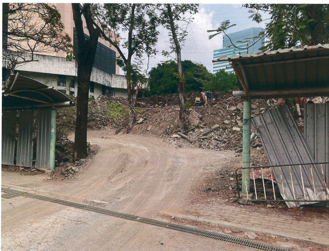
รูปด้านหน้า-ทางเข้า